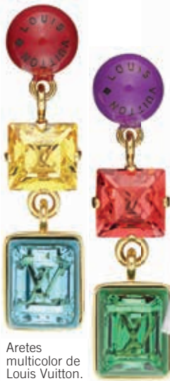
Aretes multicolor de Louis Vuitton.