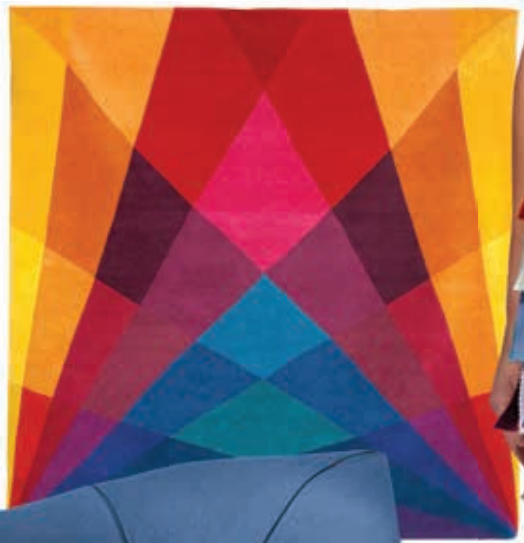
Tapete Rainbow de Sonya Winner.