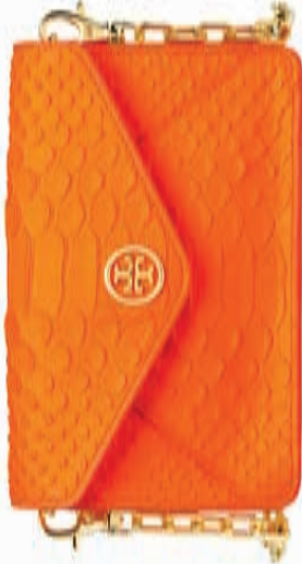
Bolso Neon Snake en naranja sunrise de Tory Burch.