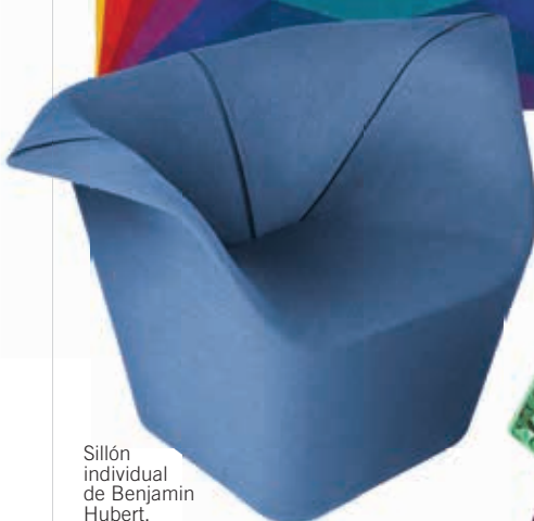
Sillón individual de Benjamin Hubert.