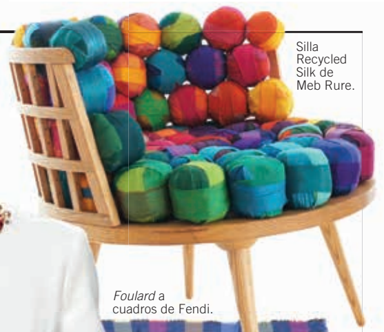
Silla Recycled Silk de Meb Rure.