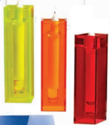
Candelabros Finally Alone de Philippe Starck para Kartell.