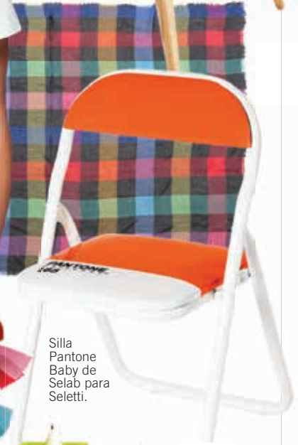
Silla Pantone Baby de Selab para Seletti.