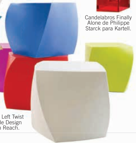
Bancos Left Twist Cube de Design Within Reach.

Como bien sabemos el color es una percepción visual que se genera gracias a la luz. En honor a este fenómeno que llena de vida la casa y nuestro guardarropa, presentamos una colección de coloridos diseños empapados de luz que te dejarán con el ojo cuadrado.